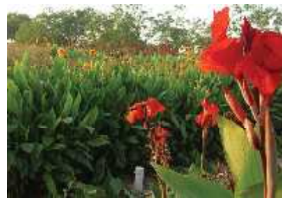
Impianto di fitodepurazione a flusso orizzontale piantumato interamente con Canna Indica.

A chi ci contatterà inviando il presente articolo riserveremo: PREVENTIVO GRATUITO e SCONTO 10% Alle signore faremo dono di una pianta di Calle o di Iris